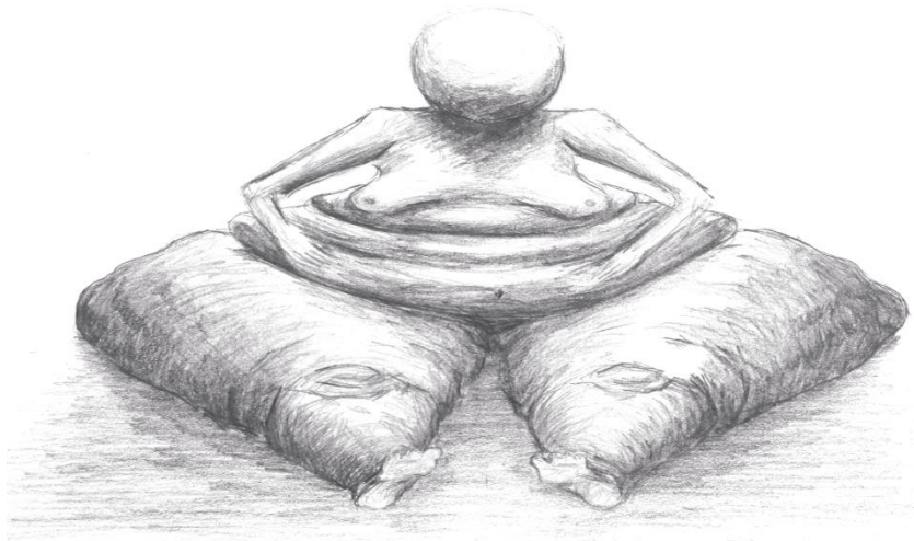
Fedmefølelsen